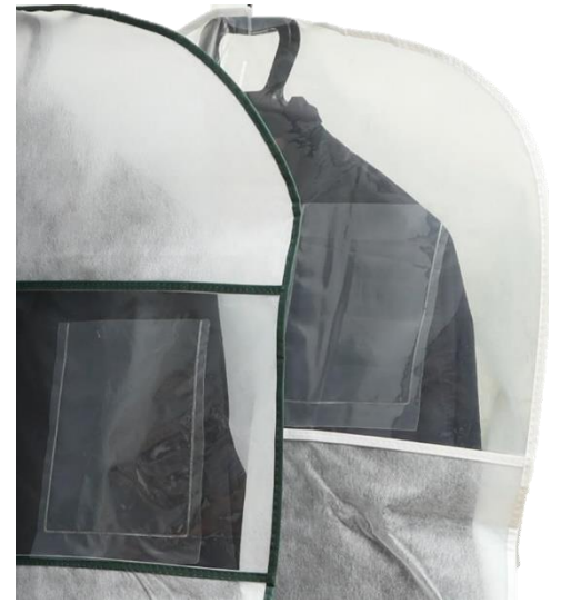
上部が透明なので外から見やすい